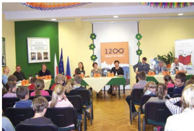
„Dorośli dzieciom” - mini konkurs recytatorski