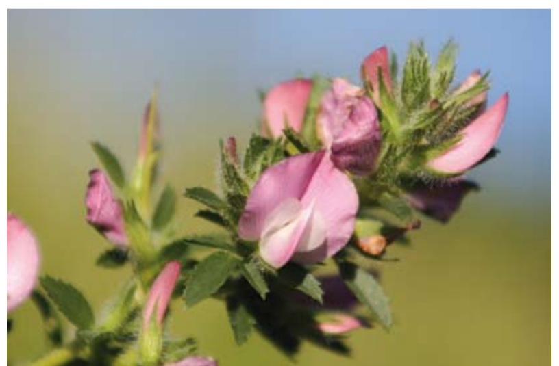
Wilżyna ciernista w rejonie ul. Majowej

Zapraszamy Czytelników do współredagowania tej kolumny. Prosimy o nadsyłanie ciekawostek związanych z Cieszynem (np. anegdot, przepisów kulinarnych, zdjęć, dokumentów, wzorów rękodzieła artystycznego itp.), które mogłyby zainteresować innych i wzbogacić wiedzę o naszym mieście. Gwarantujemy zwrot wszystkich otrzymanych materiałów.