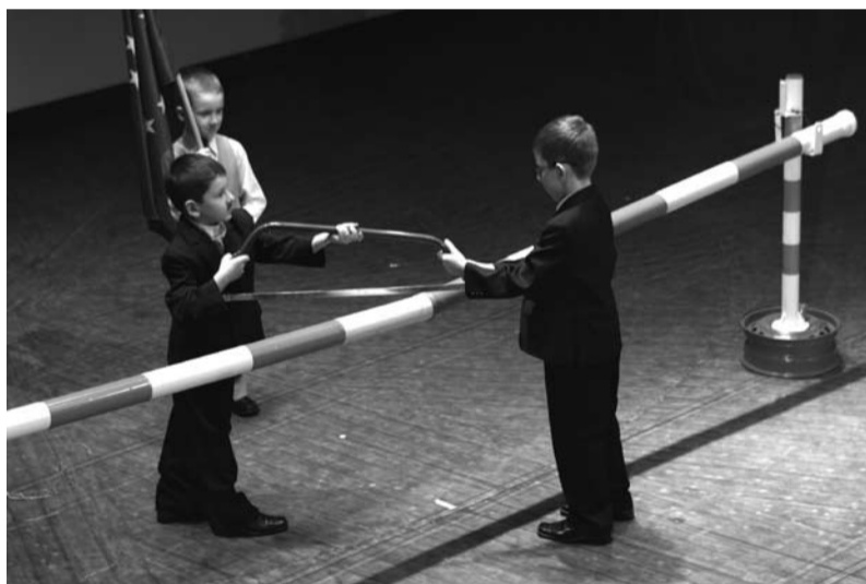
Symboliczne przecięcie szlabanu