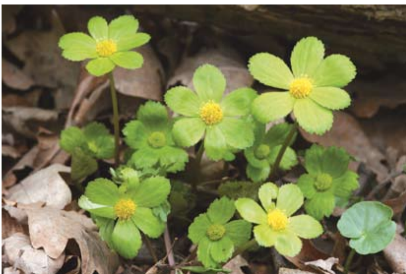
Cieszynianka wiosenna w rezerwacie „Lasek Miejski nad Puńcówką”