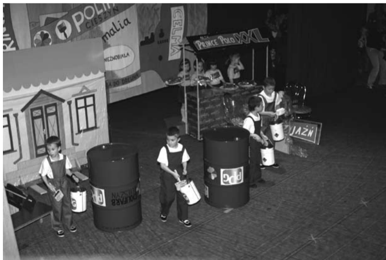
Świat cieszyńskich zakładów pracy

wewnętrznych barier, by móc w końcu zaistnieć na scenie. Nam się to udało i stwierdzam z ogromną radością w sercu, że cieszyńskie przedszkolaki wykonały zadanie w 100 procentach.