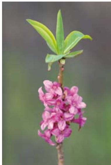
Wawrzynek wilczełyko - rezerwat „Kopce”