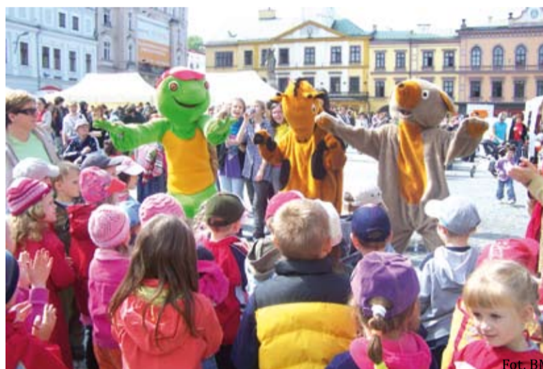
Podczas zabawy plenerowej dzieciom towarzyszyły postacie z bajek

Impreza, której tym razem towarzyszyła piękna, słoneczna pogoda, zgromadziła w centralnym punkcie miasta ponad kilkaset młodych czytelników. Bawili się wszyscy - od maluszków po nastolatki. Jak zwykle ogromną popularnością cieszyła się „Bajkowa ciuchcia”, zwolenników znalazły warsztaty regionalne, drukarskie grupy „Kalander” oraz językowe „Helen Doron”. ➔ 4